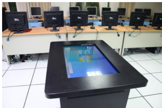
觸控桌與 42 吋多點邊框專業型觸控顯示器。