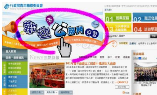
行政院青年輔導委員會首頁。

鑑於去年青年學子至公部門見習僧多粥少的情形，今年青輔會積極聯繫公股銀行、公營企業政府機關等提供見習機會，目前預計提供 437 名見習機會。各公部門見習項目與需求人數皆已陸續上網，鼓勵本校有興趣之同學盡早上 RICH 職場體驗網 ( http://rich.nyc.gov.tw ) 查閱，或透過青輔會首頁點選進入相關網頁報名。另外為了照顧弱勢族群，本見習機會以原住民、弱勢學生與身心障礙者為優先錄取。