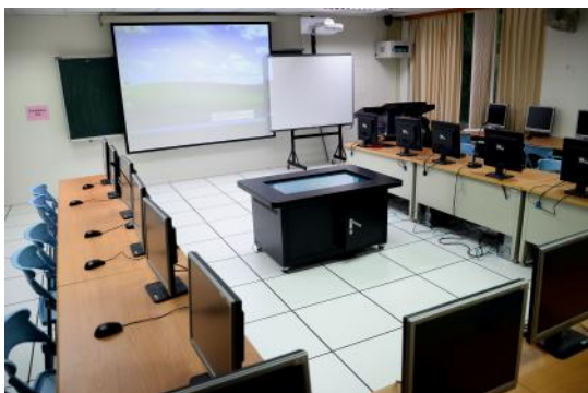
雲起樓 211 微型教室正式啟用了!

所謂微型教學(Microteaching)是源自於 1930 年代師資教育中的一個迷你課程(mini courses)。在 1950 年代, 由美國史丹佛大學 Allen 和 Rgan (1963) 兩位學者加以研究與發展。微型教學的目的在於訓練教師掌握課堂教學的技能, 藉以改善課堂教學。教學者在實際演練的教學技能中, 透過數位攝影設備, 回顧影音和討論等資料, 而獲得其技能表現的回饋。例如: 板書字體的大小、音量的控制、上課站姿或位置、媒體的使用、講述法的掌握、實驗課程分組或一般課程採用合作學習分組帶領的技巧等。與傳統的教學實習課程形式有所不同, 教學者可以在微型教室中得到更多的心理支援和訊息回饋。