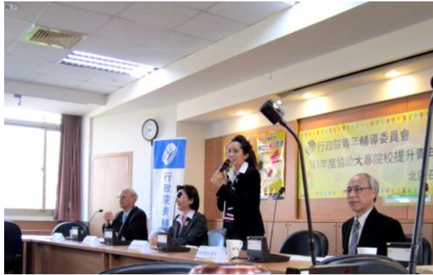
青輔會陳以真主委到場致詞。

行政院青年輔導委員會協助大專校院提升青年就業力 101 年北區第一次工作會報，3 月 5 日於德霖技術學院召開，新任的青輔會陳以真主委到場跟北區各大專校院職輔工作同仁勉勵，並說明青輔會目前推動的相關業務，包含創業服務、職涯發展、公共參與及志願服務、旅遊學習等四大方向，青輔會除了現有業務繼續推動外，未來將提供更多資源給各大專校院，協助青年學子無論在學或畢業後皆得以找到人生職涯方向，開拓出另一片天空。