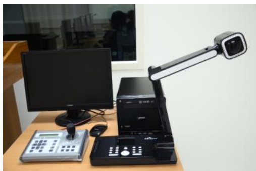
多視埠影音錄製系統。