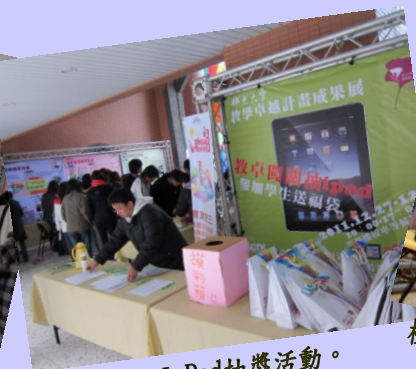
準備 iPad 抽獎活動。