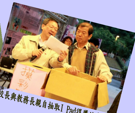
校長與教務長親自抽取 iPad 得獎的幸運兒。