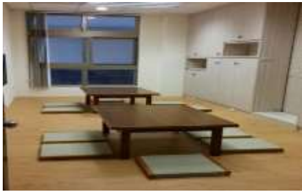
(7) 1樓_學生交誼室：供本系學生課間停留、交誼、自習討論空間。