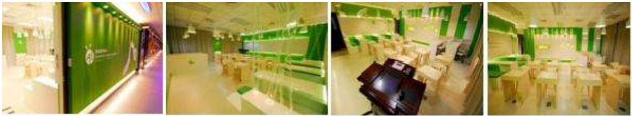
(4) iOS 專業教學教室